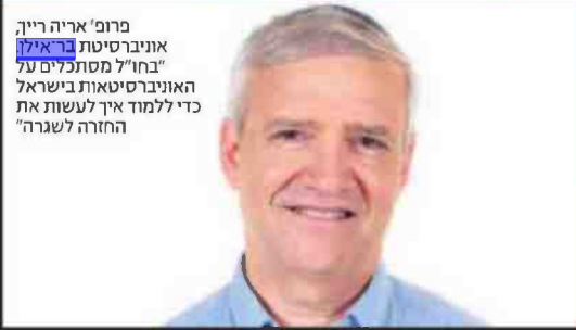
פרופ' אריה רייך, אוניברסיטת בר אילן "בחו"ל מסתכלים על האוניברסיטאות בישראל כדי ללמוד איך לעשות את החזרה לשגרה"