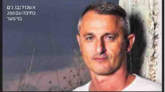
אשכול נבו, ג'ם כתיבה עם 200 בני נוער