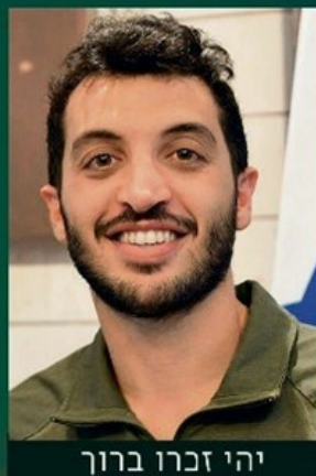
יהי זכרו ברוך

בוגר תואר ראשון בתוכנית מורשה במדור לזרועות הביטחון לוחם ימ"מ מהישוב הר גילה בן 28 בנופלו